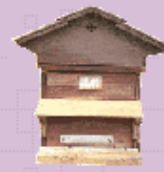
Rucher de POISY