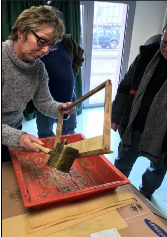
Atelier cire et cadres 23 Février